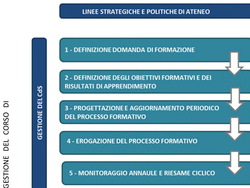
Figura 2 – Progettazione e miglioramento continuo del CdS

I macro-processi delineati di seguito e schematizzati nella Figura 2 sono finalizzati a fornire ai CdS un quadro di riferimento per la progettazione e la gestione dei percorsi formativi in un'ottica di miglioramento continuo della formazione e di soddisfacimento dei requisiti per la Qualità.